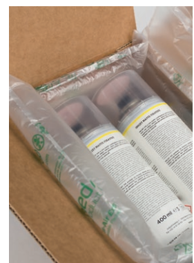
Anwendung mit Folie Fill-Air Extreme®