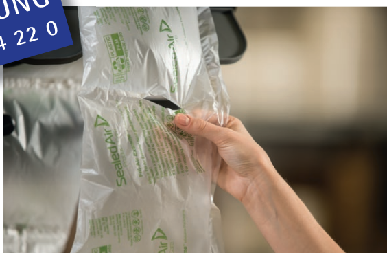
Fill Air Extreme® Folie

BESTELLUNG UND BERATUNG +49 (0) 77 61 | 94 22 0