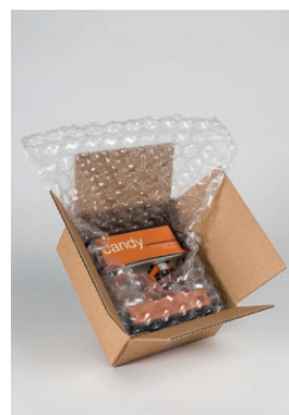
Anwendung mit Folie Bubble Wrap IB® Medium