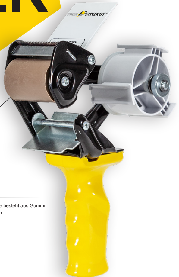
Die Auftragswalze besteht aus Gummi mit Kunststoffkern