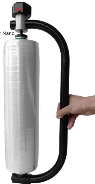
Stretchfilm Nano stable Hand plus PackSynergy Nano stable Dispenser